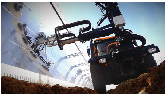
Vehículo que mejor se adapta a terrenos irregulares

El personal de Fermupe cuenta con amplia experiencia y cualificación en la realización de estos trabajos, actuando como asesor con el cliente para la obtención de los mejores resultados en cada momento y en función de sus necesidades.