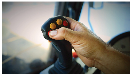
Josting ergonómico para su fácil manejo