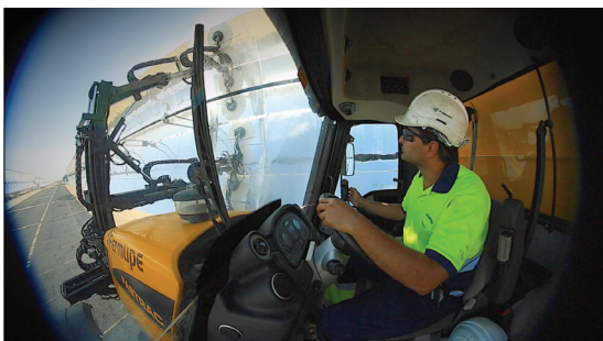
Vehículo con cabina centrada para la mejor visibilidad y seguridad